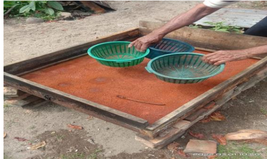
Gambar 4. Proses Penggaraman Ikan Teri

Prosesnya hampir sama menurut Wardani et al. , (2016) bahwa cara pengawetan ikan agar tidak mengalami kebusukan oleh bakteri pembusuk dengan menambahkan garam 15-20% pada ikan segar atau ikan setengah basah, kemudian ikan teri direbus dalam air garam (15%) yang mendidih selama 3 menit;