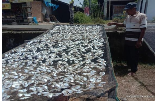
Gambar 6. Proses Angin-angin Ikan Teri