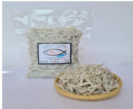
Gambar 7. Pengemasan Teri Asin

produk ikan teri olahan dari daerah lain seperti teri Medan, dan harganya lebih tinggi bila dipasarkan (Yusra et al. , 2019). Pengemasan yang dilakukan adalah dengan cara ikan teri dimasukkan kedalam plastik PE ukuran 0,5 kg, selanjutnya dilakukan pengemasan menggunakan alat sealer.