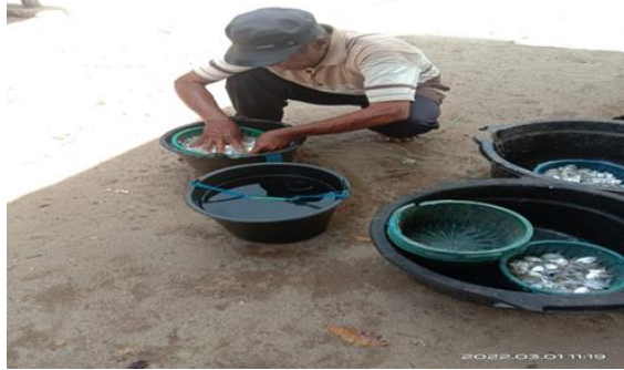
Gambar 3. Menyortir Ukuran Ikan Teri