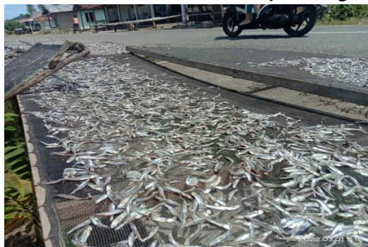
Gambar 5. Proses Penjemuran Ikan Teri